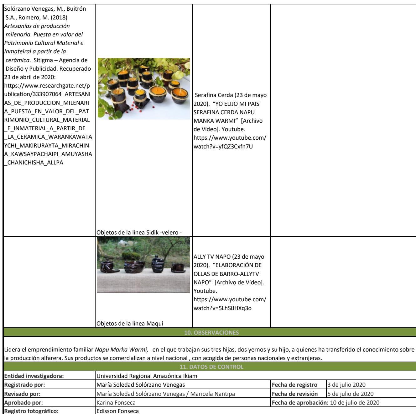
Objetos de la línea Sidik -velero -