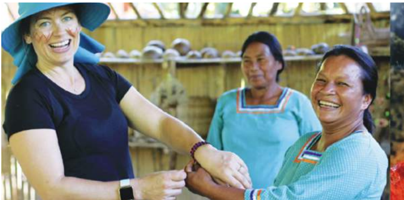
Barrio / Guayusa pampa Kachiwañuska kushkapi