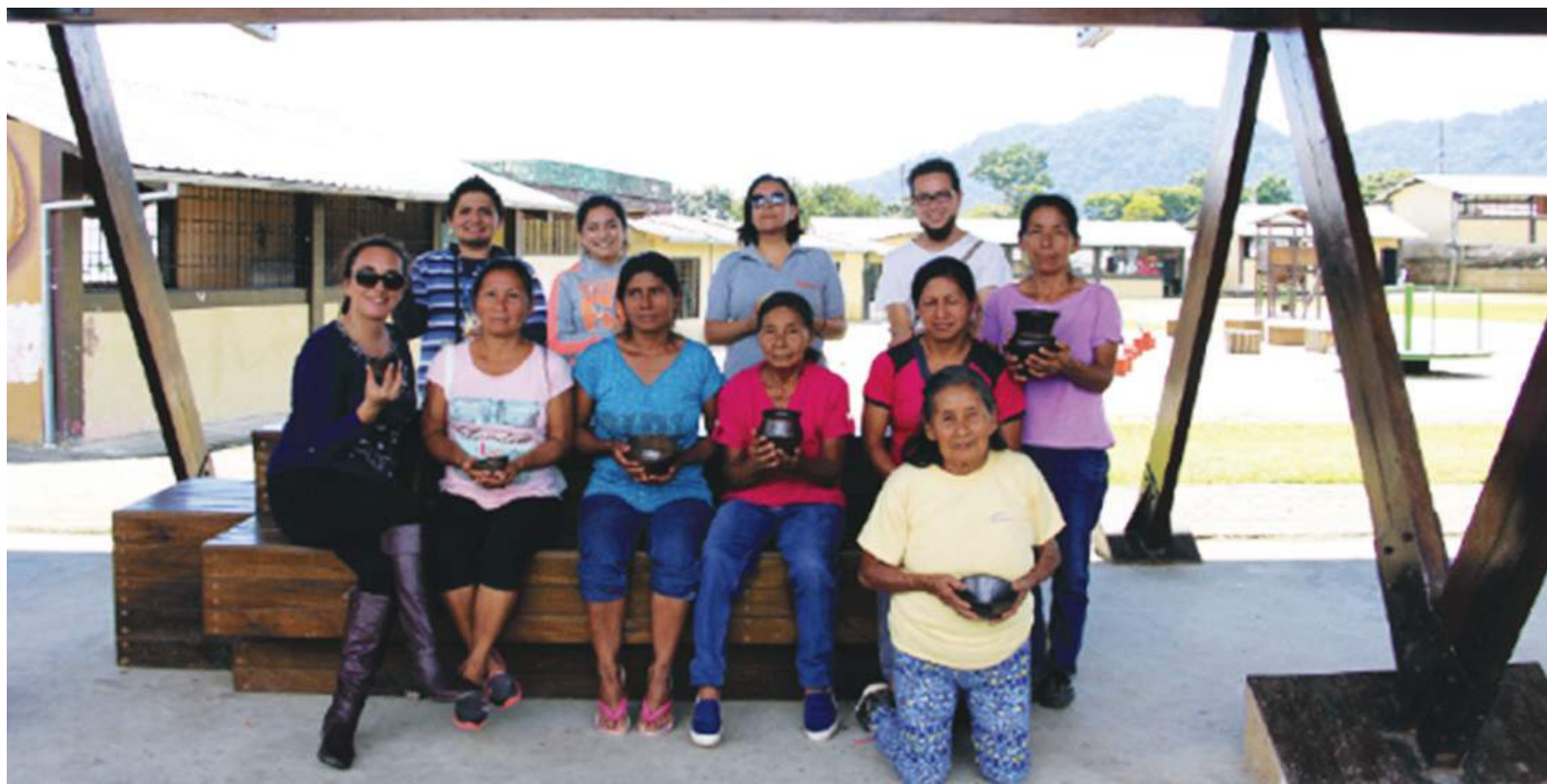
■ Alfareras Santa Rita / sañunakuykuna ■ Fotos / Rikchakuna : Leidy Herra