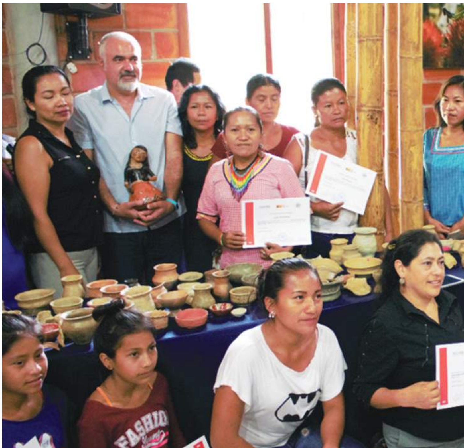
Talleres Artesanías de producción milenaria / Rurasachakuy makiruray mirachinata warankawataychi