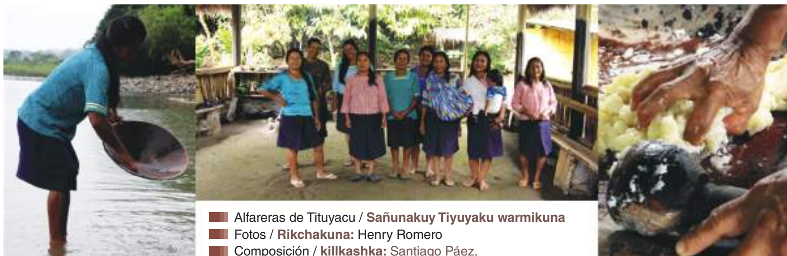
■ Alfareras de Tiyuyacu / Sañunakuy Tiyuyaku warmikuna ■ Composición / killkashka : Santiago Páez.

Un emprendimiento familiar inició hace más de quince años en Tiyuyacu, organizado con fines turísticos, en donde se realizan demostraciones de preparación de chicha de yuca y chonta, de obtención de oro mediante bateado, procesos de producción de cerámica y venta de artesanías, son principalmente mujeres quienes realizan las exposiciones (Sarmiento, 2012).