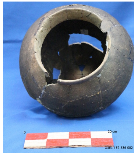
Descripción: Objeto elíptico tipo Cosanga. Vista interior, posterior al proceso de reconstrucción.