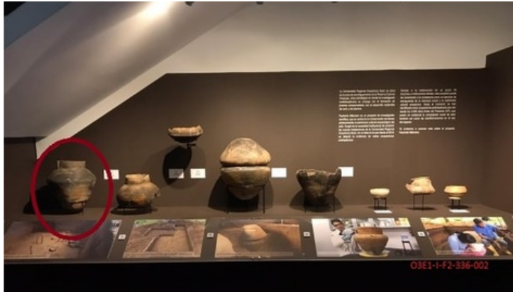
Descripción: Objeto elíptico tipo Cosanga. Vista en área de exhibición.