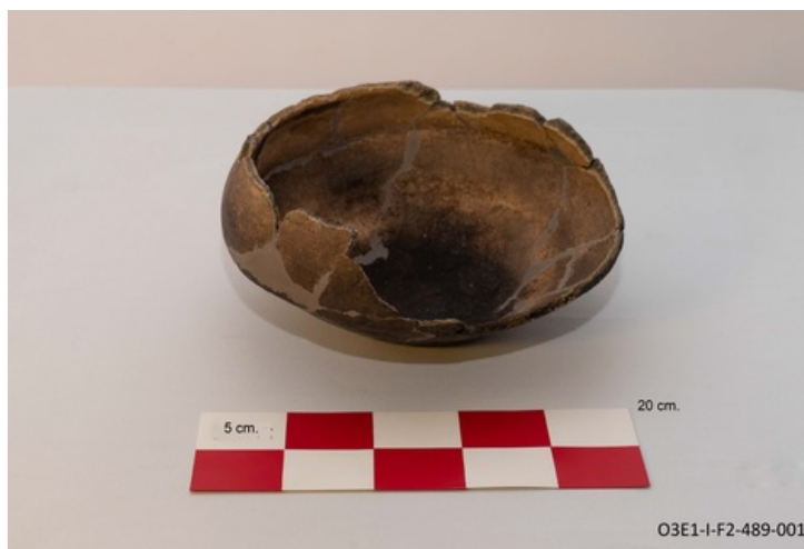
Descripción: Base y cuerpo de vasija Cosanga reconstruida. Vista posterior al proceso de consolidación.